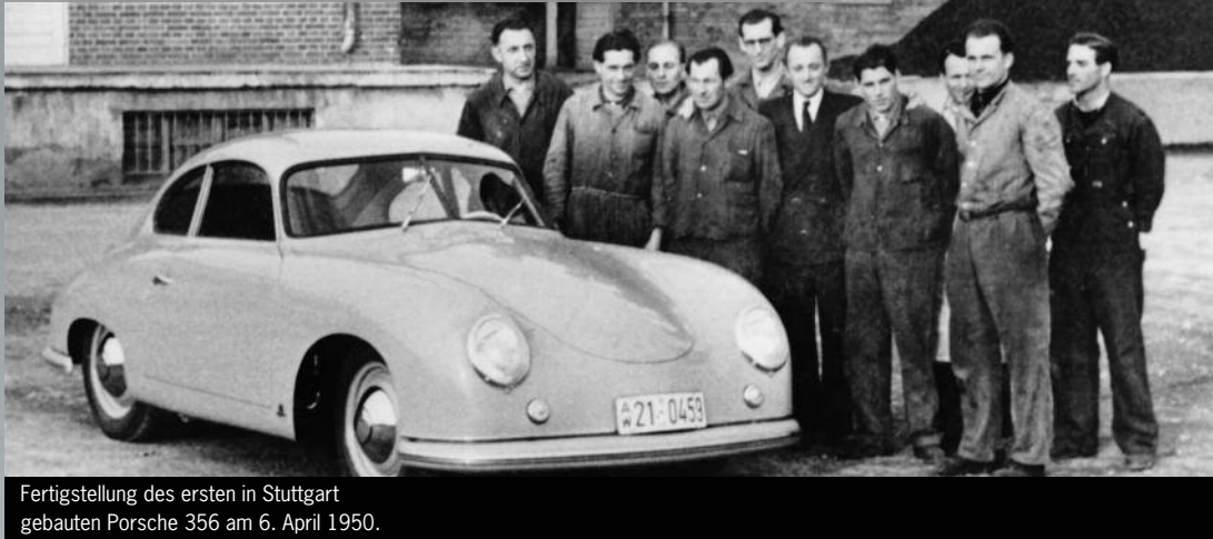
Fertigstellung des ersten in Stuttgart gebauten Porsche 356 am 6. April 1950.