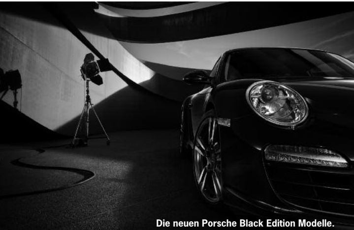
Die neuen Porsche Black Edition Modelle.