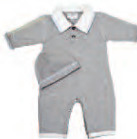
Kinder Strampler-Set WAP 723 056-068 0B EUR 69,00

Mit tiefem V-Ausschnitt. Modische Rippenstricke entlang des Ausschnittes. Webband mit Swarovski Kristallen und Porsche Schriftzug am Saum. 100 % regenerierte Proteinfaser. In Asphaltgrau. Größen: XS, S, M, L, XL, XXL.