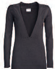
Damen Strickpullover WAP 777 OXS-XXL 0B EUR 239,00

Leicht tailliert durch Naht im Vorderteil. Nach vorn verlegte Schulternaht. Zwei-Knopf-Manschette mit dezentem Porsche Schriftzug. 98 % Baumwolle, 2 % Elasthan. In Weiß. Größen: S, M, L, XL, XXL, XXXL.