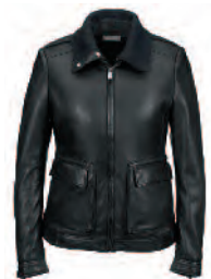
Auch als Damen Lederjacke erhältlich WAP 975 OXS-XXL 0B EUR 859,00

Mit aufgesetzten Doppeltaschen und abnehmbarem Strickkragen. Aufwendig gestaltetes Innenfutter mit diversen Taschen. Jacke: 100 % Lammnappa. Futter: 68 % Viscose, 32 % Polyester. Kragen: 100 % Baumwolle. In Schwarz. Größen: S, M, L, XL, XXL, XXXL.