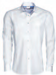
Herren Hemd WAP 757 00S-3XL 0B EUR 129,00

Leicht tailliert durch Naht im Vorderteil. Nach vorn verlegte Schulternaht. Zwei-Knopf-Manschette mit dezentem Porsche Schriftzug. 98 % Baumwolle, 2 % Elasthan. In Weiß. Größen: S, M, L, XL, XXL, XXXL.