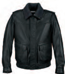
Lederjacke WAP 974 00S-3XL 0B EUR 890,00

Mit Kapuze und zwei seitlichen Einschubtaschen. Großer Porsche Schriftzug auf dem Rücken. 100 % Polyester. In Asphaltgrau. Größen: 92/98, 104/110, 116/122, 128/134, 140/146.