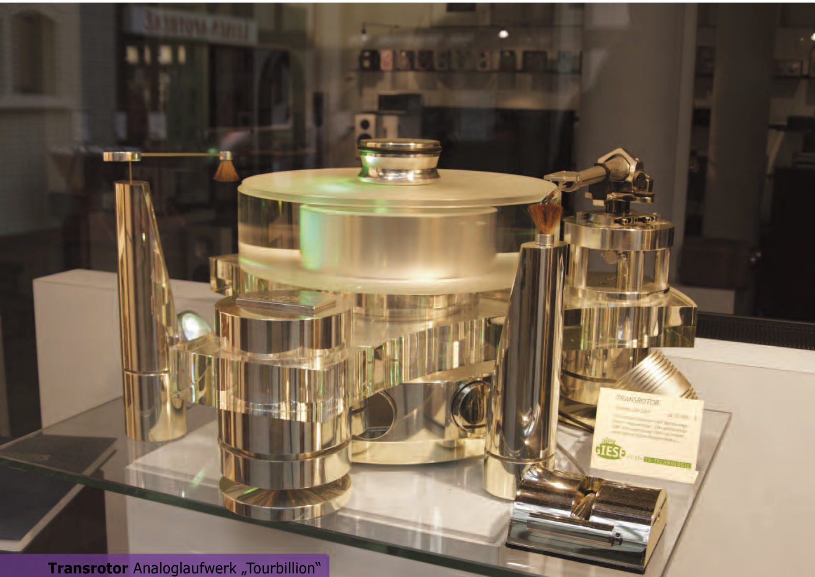
Transrotor Analoglaufwerk „Tourbillion“