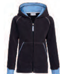
Kinder Fleecejacke WAP 721 092-140 0B EUR 85,00

Kragen in 2-in-1 Look. Großer Porsche Schriftzug auf dem Ärmel. Beine durch Druckknöpfe komplett zu öffnen. 100 % Baumwolle. In Eisgrau. Passende Mütze mit Porsche Schriftzug. 95 % Baumwolle, 5 % Elasthan. Größen: 56/62, 68/74.