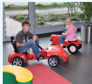
Früh übt sich ...

Mittelkonsole den Fahrer noch mehr in das Fahrzeug. Ganz so, wie es sich für einen Sportwagen gehört. Ob größerer und variabler Fond, noch mehr Komfort auf den hinteren Sitzen oder die umfangreiche Serienausstattung – den neuen Cayenne muss man erleben oder noch besser: erfahren. Dazu laden wir Sie hiermit herzlich ein.