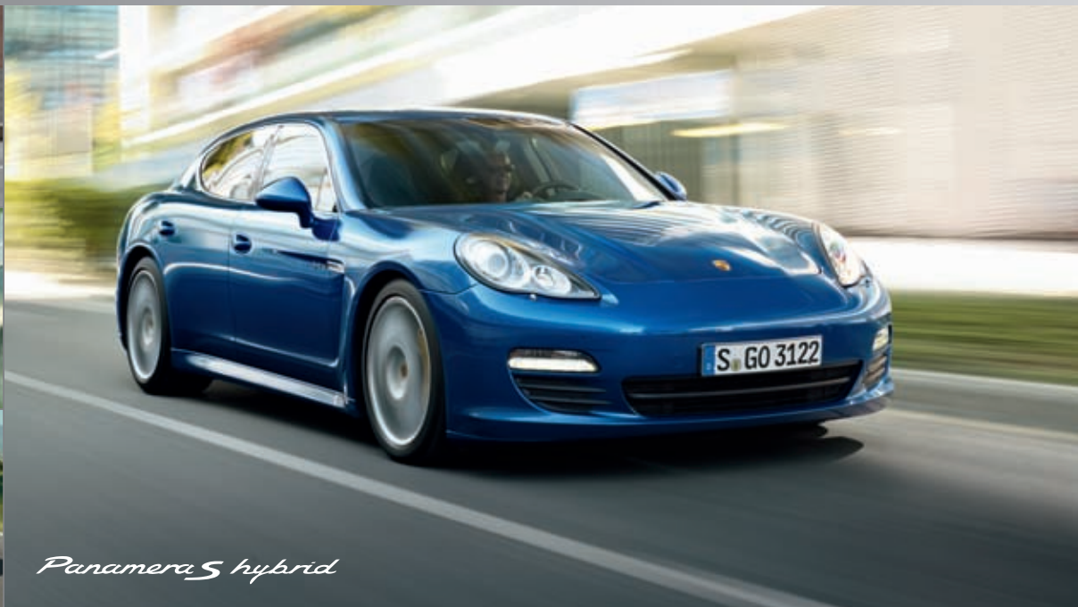
Panamera S hybrid

Sportlichkeit und Effizienz: ergibt Fahrspaß für vier.