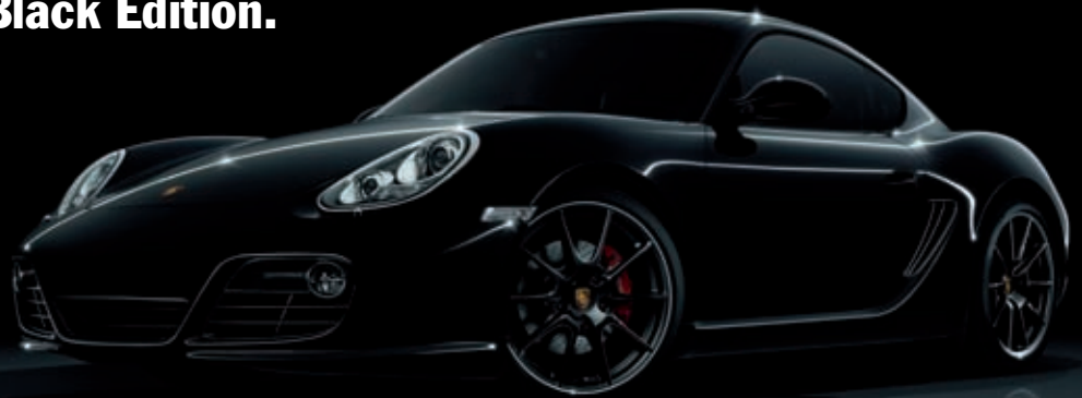
Die Cayman S Black Edition. Limitiert auf 500 Stück.

Möchte man Anziehungskraft mit einer Farbe beschreiben, kommt nur eine infrage: Schwarz. Doch genaugenommen ist Schwarz ja noch viel mehr. Im Fall der Cayman S Black Edition ein Bekenntnis. Für den eigenen Stil, den eigenen Willen – den eigenen Weg.