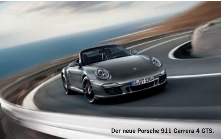
Der neue Porsche 911 Carrera 4 GTS.

„Denn nichts, was zur Glückseligkeit gehört, darf unvollkommen sein.“