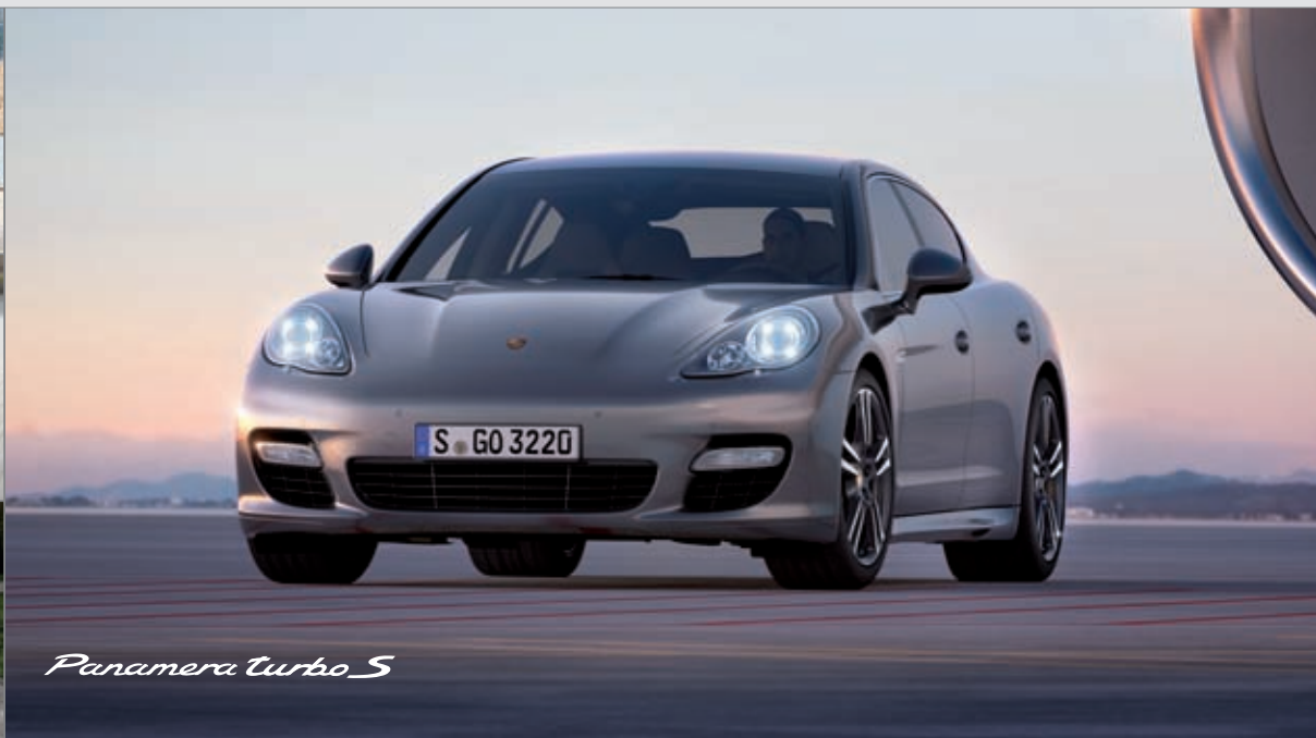
Panamera Turbo S