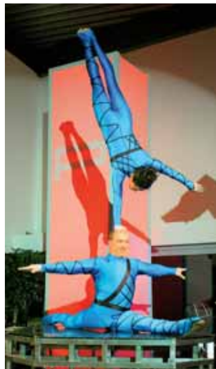
Ein Highlight des Events. Handstand-Akrobatik vom Feinsten. Künstler, direkt aus dem GOP in Hannover.