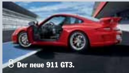
8 Der neue 911 GT3.