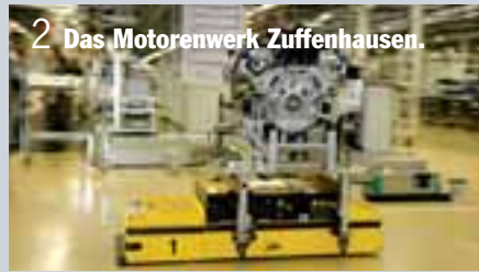
2 Das Motorenwerk Zuffenhausen.

Im Mittelpunkt: Die neuen Porsche Modelle.