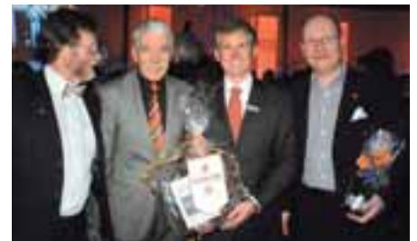
Der rote Teppich weist den Weg ins neue Porsche Zentrum Hannover. Jetzt ist man bei guten Freunden und alten Bekannten. Man kennt sich, hat oft gleiche Interessen und zeigt offen seine Sympathie für Porsche.