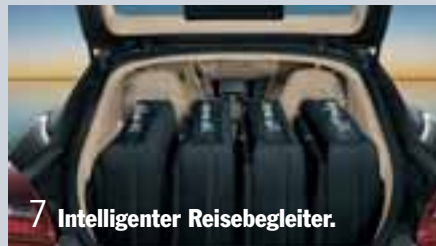
7 Intelligenter Reisebegleiter.