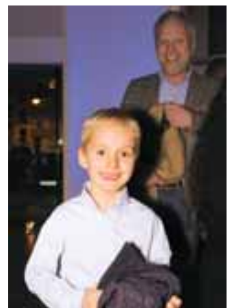
Jedem Andrang gewachsen. Das Porsche Zentrum ist großzügig dimensioniert. Der jüngste Gast an diesem Abend. Aber leider noch ein weiter Weg bis zum Führerschein.