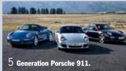
5 Generation Porsche 911.