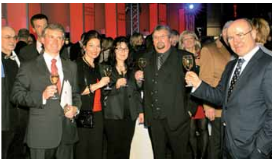
Auf eine gelungene Veranstaltung und eine erfolgreiche Zukunft!