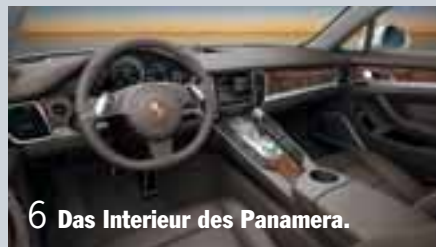
6 Das Interieur des Panamera.