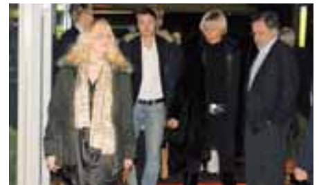
Das wird ein toller Abend – die gute Laune wird gleich mitgebracht. Gastgeschenke – an diesem Abend keine Seltenheit. Herzlichen Dank dafür.