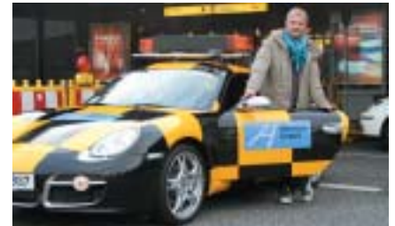
Regisseur Sönke Wortmann war einer der ersten Gäste im VIP-Shuttle des Airport.

lich geworden. Als VIP-Shuttle und Promotionsfahrzeug für viele Veranstaltungen wird der schnelle Porsche eingesetzt und wirbt für den Flughafen und das Porsche Zentrum Hannover gleichermaßen. Eine Werbemaßnahme, die den jährlich 5,7 Millionen Fluggästen des Airport Hannover sicherlich positiv auffallen wird.