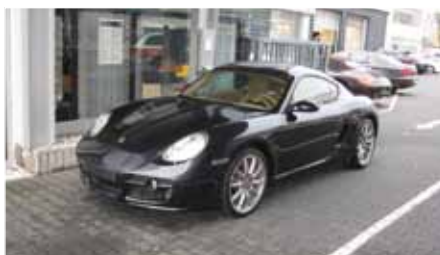
5 Porsche Cayman S Altasgraumetallic EZ 11/2007 | 34.980 km | EUR 37.899*