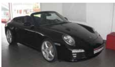
8 Porsche 911 Carrera Cabriolet Basaltschwarzmetallic EZ 04/2009 | 11.800 km | EUR 86.899*