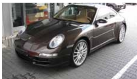
10 Porsche 911 Carrera 4 Macadamiametallic EZ 06/2008 | 53.000 km | EUR 59.899*