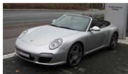
9 Porsche 911 Carrera S Cabriolet Arktissilbermetallic EZ 02/2009 | 41.500 km | EUR 77.899*