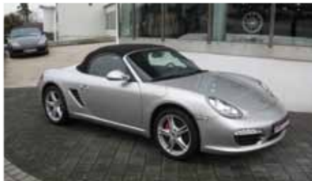
2 Porsche Boxster S Arktissilbermetallic EZ 10/2010 | 10.200 km | EUR 46.899*