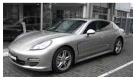
12 Porsche Panamera S Platinsilber EZ 05/2010 | 16.000 km | EUR 79.899*