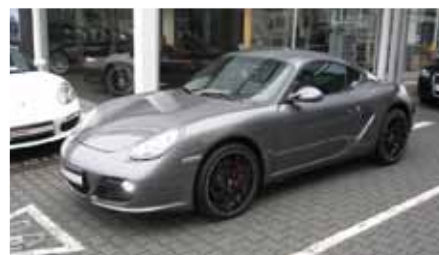
6 Porsche Cayman S Meteorgraumetallic EZ 01/2011 | 20.300 km | EUR 54.899*