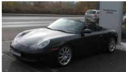
1 Porsche Boxster Basaltschwarzmetallic EZ 12/2002 | 123.450 km | EUR 19.899*

Tagesaktuelle Angebote finden Sie unter www.porsche-limburg.de .