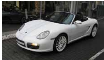
3 Porsche Boxster S Design Edition 2 Carraraweiß EZ 10/2010 | 10.200 km | EUR 46.899*