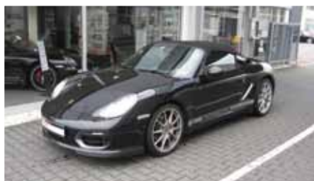
4 Porsche Boxster Spyder Schwarz EZ 09/2010 | 14.200 km | EUR 64.899*