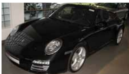
11 Porsche 911 Carrera 4 Cabriolet Nachtblau-metallic EZ 06/2008 | 9.100 km | EUR 46.900