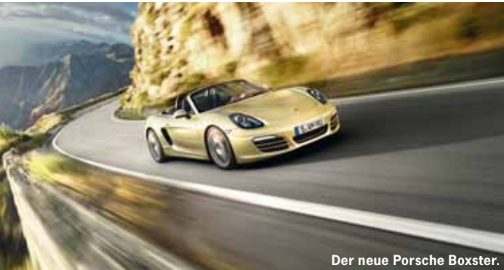
Der neue Porsche Boxster.