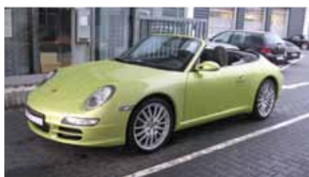
7 Porsche 911 Carrera Cabriolet Individualfarbe metallic EZ 09/2007 | 37.180 km | EUR 59.899