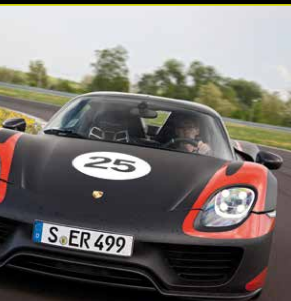
Porsche 918 Spyder • Kraftstoffverbrauch (in l/100 km) kombiniert: 3,3–3,0; CO 2 -Emissionen: 79–70 g/km; Stromverbrauch kombiniert: 13,0–12,5 kWh/100 km; Effizienzklasse A+