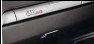
Oberhalb des Handschuhfachs zeigt eine Plakette die Limitierungsnummer an.