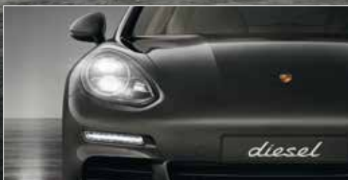
DIE BI-XENON-SCHEINWERFER mit automatischer dynamischer Leuchtweitenregulierung sind im neuen Panamera Diesel Serie.

Was dabei herauskommt, wenn wir einen Sportwagen für die Langstrecke weiterentwickeln? Immer ein Sportwagen.