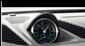
Design-Zitat: Bis 1967 war die Ziffern- und Skalenfarbe der Instrumente grün und die Zeiger weiß.

Schon von außen ist die klassische 911 DNA unverkennbar: z. B. an den rund ausgeformten Scheinwerfern und den Lufteinlasslamellen. Im Jubiläumsmodell sind sie zusätzlich mit Chrom akzentuiert, genau wie das Heckdeckelgitter hinten. Es verrät, wo der Motor sitzt: Sechs Zylinder, in Boxeranordnung, inklusive typischem Porsche Sound. So weit die Tradition. Doch kommen wir zur Zukunft: Denn mit dem Motor des Porsche 911 Carrera S bewegt sich das Jubiläumsmodell eindeutig auf dem neuesten Stand der Zeit. Mit 3,8 Litern Hubraum entwickelt der Motor eine beeindruckende Leistung von 294 kW (400 PS). So beschleunigt das