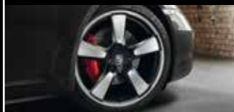
Nicht nur von Sammlern hochbegehrt: die Sport Classic Räder im legendären Fuchsfelgendesign.

Jubiläumsmodell 50 Jahre 911 mit 7-Gang-Schaltgetriebe in 4,5 s von 0 auf 100 km/h und erreicht eine Höchstgeschwindigkeit von 298 km/h. Ebenfalls zukunftsweisend sind die Verbrauchswerte, die der hohen Leistung des Jubiläumsmodells gegenüberstehen: Denn mit 8,7 l/100 km (in Verbindung mit dem optionalen PDK) liegen sie vergleichsweise niedrig. Grund dafür sind serienmäßige Effizienztechnologien wie Auto Start-Stop-Funktion, Thermomanagement oder Bordnetzrekuperation, die auch im Jubiläumsmodell 50 Jahre 911 integraler Bestandteil des Fahrzeugkonzepts sind.