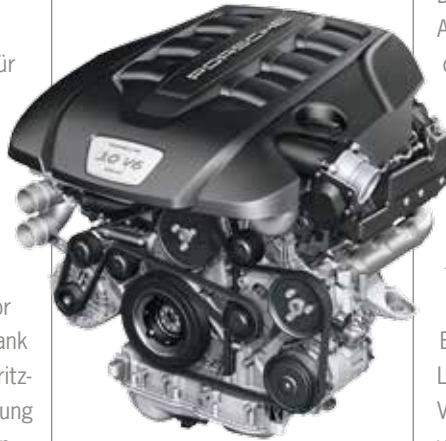
DER V6-MONOTURBO DIESELMOTOR wurde neu entwickelt und verfügt erstmals über einen wassergekühlten Turbolader mit größerem Durchmesser.

Ausgestattet mit einem V6-Monoturbo Dieselmotor bringt er eine Leistung von 300 PS – und bietet dank neu entwickelter Kolben, einem optimierten Einspritz- und Ventilsystem sowie verbesserter Ladeluftkühlung ganze 50 PS mehr als sein Vorgängermodell. Ein weiterer Grund für die enorme Leistungssteigerung: der vergrößerte Turbolader. Im neuen Modell ist er erstmals mit einer Wasserkühlung ausgestattet, die für eine optimale Wärmeabfuhr sorgt. Im Zuge all dieser Optimierungen konnte die Höchstgeschwindigkeit auf 259 km/h gesteigert werden – Porsche Performance in seiner reinsten Form.