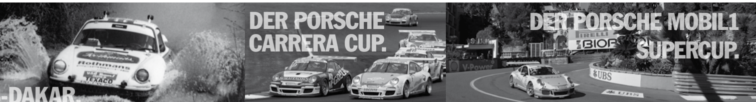
DER PORSCHE CARRERA CUP.

Der Porsche 911 geht in zahlreichen nationalen und internationalen Rennserien an den Start: so zum Beispiel beim Porsche Sports Cup Deutschland, der 2013 zum 50. Mal ausgetragen wird. Als Kundensportserie schließt er die Lücke zwischen Porsche Sport Driving School und den Porsche Markenpokalen für Rennsportprofis. Oder bei der Langstrecken-Weltmeisterschaft World Endurance Championship und der International GT Open, die seit 2006 in Europa veranstaltet wird.