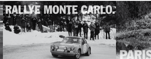
RALLYE MONTE CARLO: