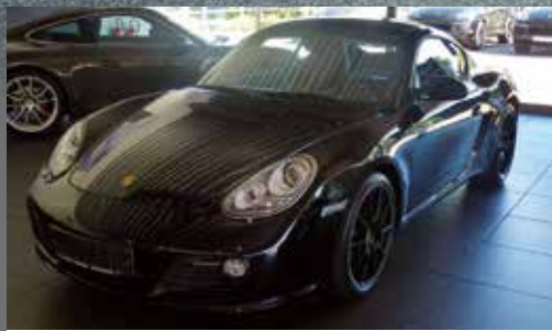
Porsche Cayman S Black Edition | EUR 55.990*

Schwarz EZ 07/2011 | 15.436 km Monatliche Leasingrate: EUR 650 Laufzeit: 36 Monate