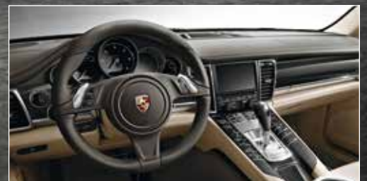
DAS MULTIFUNKTIONSLENKRAD erlaubt die komfortable Bedienung von Audio-, Telefon- und Navigationsfunktionen sowie Bordcomputer.

Mit überragender Sportlichkeit und beeindruckenden 300 PS. Bei extrem niedrigem Verbrauch und hoher Effizienz. Garantiert ohne Kompromisse.