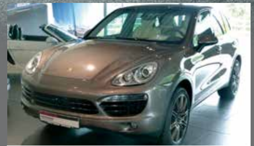
Porsche Cayenne Diesel | EUR 71.380*