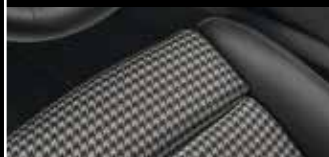
Liebvolle Reminiszenz: Die Sitzmittelbahnen greifen das Pepita-Muster auf, das in den ersten 911 Modellen stilbildend war.