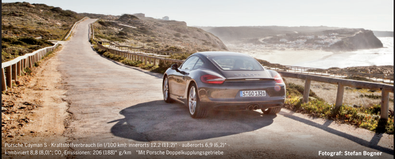
Porsche Cayman S · Kraftstoffverbrauch (in l/100 km): innerorts 12,2 (11,2)* · außerorts 6,9 (6,2)* · kombiniert 8,8 (8,0)*; CO 2 -Emissionen: 206 (188)* g/km *Mit Porsche Doppelkupplungsgetriebe