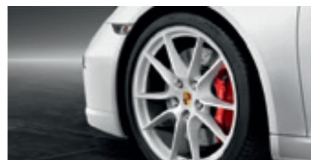
20-Zoll Carrera S Rad lackiert in Exterieurfarbe

Ihr direkter Weg zum ausführlichen Porsche Exclusive Programm.